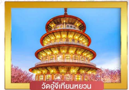
วัดอู่เจียนหยวน