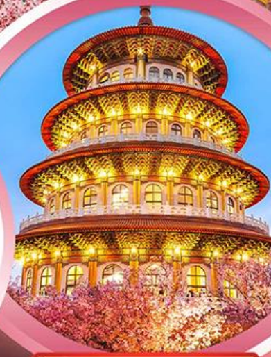
วัดจู้เทียนหยวน

ช้อปปิ้งจุใจ ย่านซีเหมินติง ตลาดไทจงไนท์มาร์เก็ต อิมอร่อยกับ..เมนูปลาประรานาธิติ ชาบูบุฟเฟ่ต์สไตล์ไต้หวัน เสียวหลงเปา